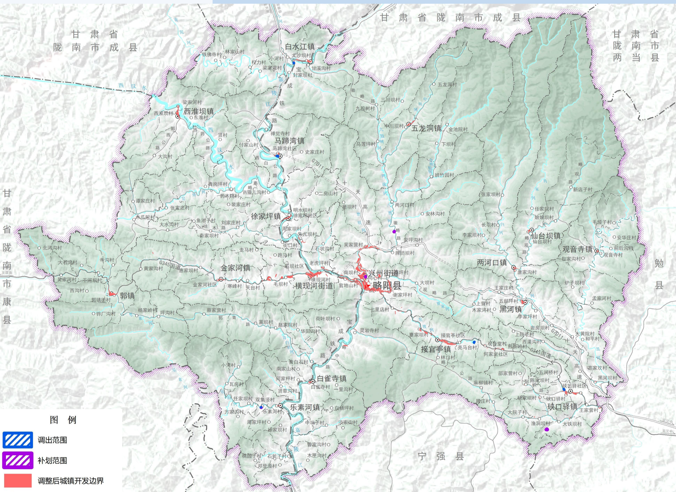
城镇开发边界正向优化图

本次动态维护为保障“十五五”规划重点建设项目需求，共调入城镇开发边界地块4块，总面积1.4985公顷，新增城镇建设用地规模1.0782公顷。按照正向优化原则，城镇开发边界规模及新增建设用地规模不增加。规划调出图斑5处，调出总面积1.4985公顷，调出新增建设用地1.0782公顷。调整后略阳县城镇开发边界总面积为875.5499公顷，整体保持不变；规划新增城镇建设用地规模为82.9997公顷，整体保持不变；城镇开发边界扩展倍数为1.16，整体保持不变。